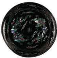
흑칠운룡나전대분 (黑漆雲龍螺鈿大盆)

류큐왕국에서는 품질을 유지하기 위해 가이즈리부교소라 불리는 관립 조직을 두었으며 이 조직의 관리 하에 중국 황제나 일본의 쇼군, 다이묘(영주)에게 주는 헌상품으로 흑칠(黑漆)에 정교한 나전(螺鈿) 기법으로 중국적인 풍경이나 설화를 나타낸 칠기가 많이 만들어졌다.