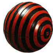
주흑칠(朱黑漆) 띠구형 봉봉사탕함

류큐 처분에 따른 오кина와현 설치로 칠기 제작은 민간공방으로 옮겨졌다. 오кина와현 밖으로의 토산품이나 일용품으로서 오кина와의 풍물을 그린 칠기가 많이 만들어졌으며 또 전통적인 문양뿐만 아니라 참신하고 현대적인 디자인의 칠기도 만들어지게 되었다. 오кина와현(戰)으로 인해 칠기산업은 괴멸 상태에 빠지게 되었지만 전후 곧 복귀로의 발걸음을 서둘러 미군 통치 시대에는 미군이나 그 가족용으로 토산품 등의 칠기가 많이 만들어졌다.