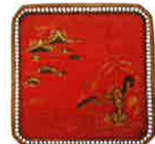
주칠산수누각인물박회분 (朱漆山水樓閣人物箔繪盆)