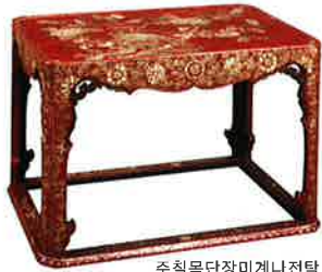
주칠목단장미계나전탁 (朱漆牡丹長尾鷄螺鈿卓)

16세기~17세기 초기의 칠기는 기술이나 무늬 등이 중국의 영향을 받아 크게 발전했다. 주홍이나 초록의 바탕색에 침금(沈金) 기법으로 그릇면 전체에 빈틈 없이 문양을 나타낸 칠기나 주칠(朱漆)에 나전(螺鈿) 기법으로 꾸민 칠기 등이 있다. 태양과 봉황, 당초(唐草) 문양의 조합이나 중국풍의 화조도(花鳥圖) 등이 대표적인 문양이다.