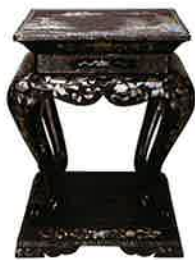
흑칠산수누각나전중앙탁 (黑漆山水樓閣螺鈿中央卓)