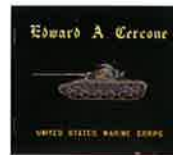
흑칠(黑漆) 미군전차퇴금(堆錦) 앨범 표지