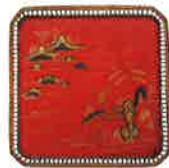
朱漆山水樓閣人物箔繪盆