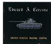
黑漆美軍戰車堆錦相簿封面