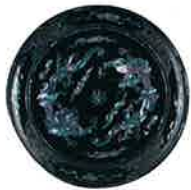
黑漆雲龍螺鈿大盆

琉球王國為了維持品質，在一個稱做貝摺奉行所的王府組織的管理下，製做了許多黑漆加上精緻螺鈿技法表現的中國式風景與故事的漆器，作為給中國皇帝與日本將軍、諸大名供品。