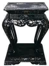
黑漆山水樓閣螺鈿中央桌