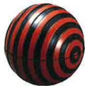
朱黑漆帶切入球型糖果盒

因廢除琉球設置沖繩縣，故漆器製作移往民間工房。製作了許多畫上沖繩風景的漆器來當作縣外的伴手禮與日用品，且不單只有傳統紋樣，也開始製作斬新現代風格設計的漆器。雖然因沖繩戰爭漆器產業呈現毀壞狀態，但是戰後馬上進行了復元，美軍統治下的時代，也製作了許多適合美國軍人與其家人的伴手禮等的漆器。