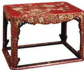
朱漆牡丹尾長鳥螺鈿桌

16世紀~17世紀初期的漆器，技術與紋樣等受到中國的影響而大肆發展。有在朱色與綠色的底色上，以沈金技法在器物上全面無空隙地畫紋樣的漆器，還有在朱漆上以螺鈿技法裝飾的漆器等。代表性的紋樣有太陽、鳳凰與唐草文的組合，還有中國式的花鳥圖等。